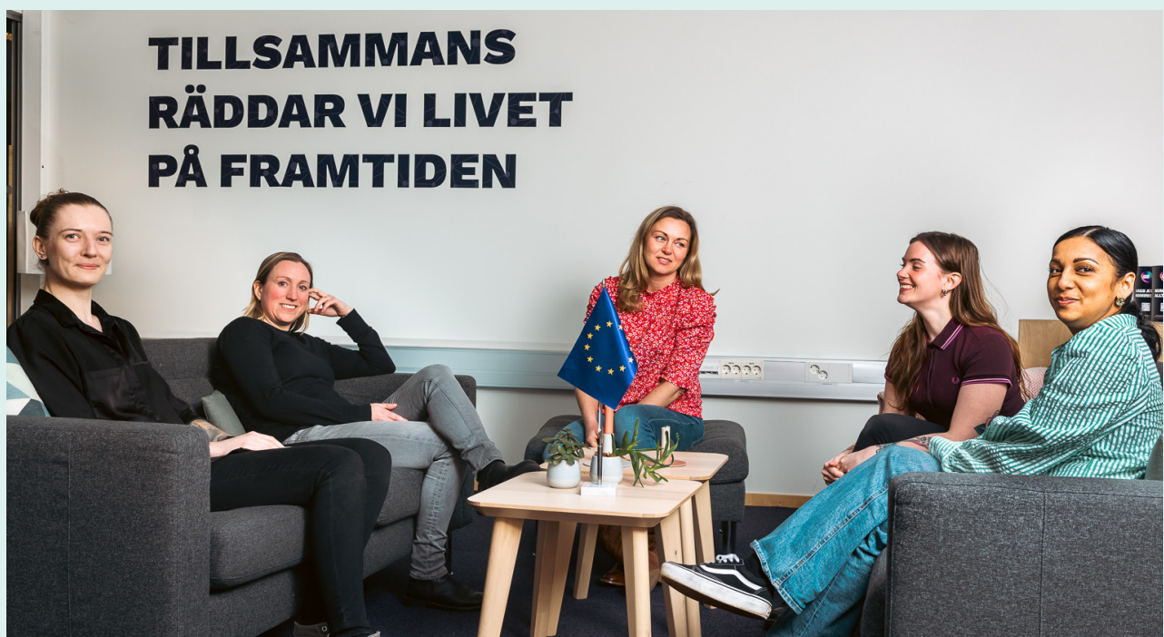
Projektgruppen för Den digitala förflyttningen